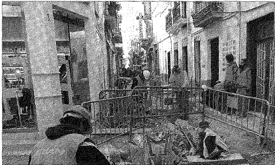
Els treballs de vianantització contribueixen al descens de clients, segons la FECES